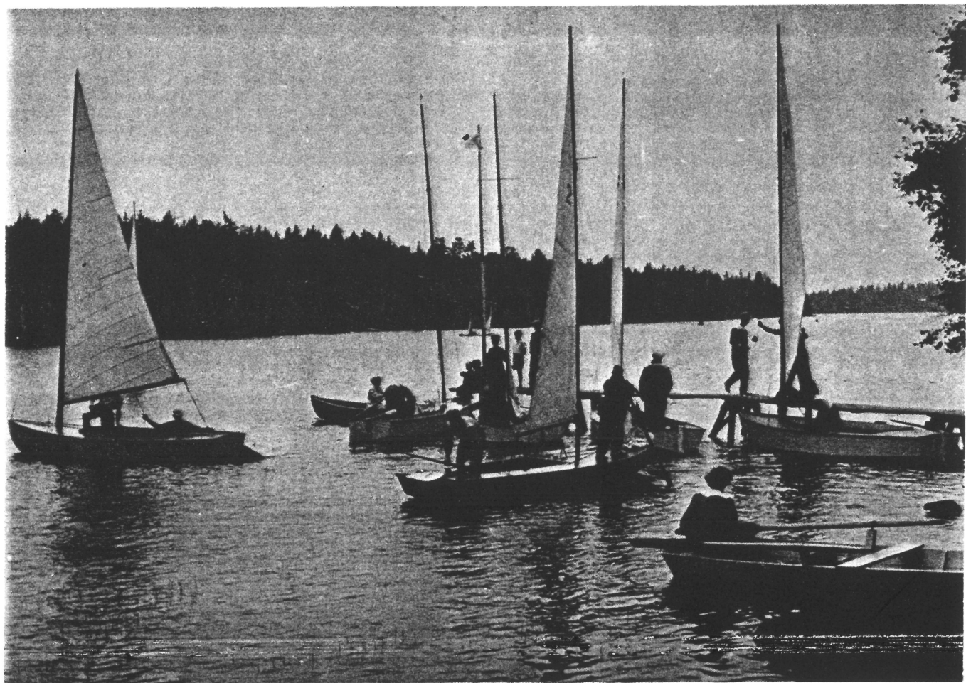
Förberedelse innan start vid dåvarande båtbyggen någon gång på 1950-talet.