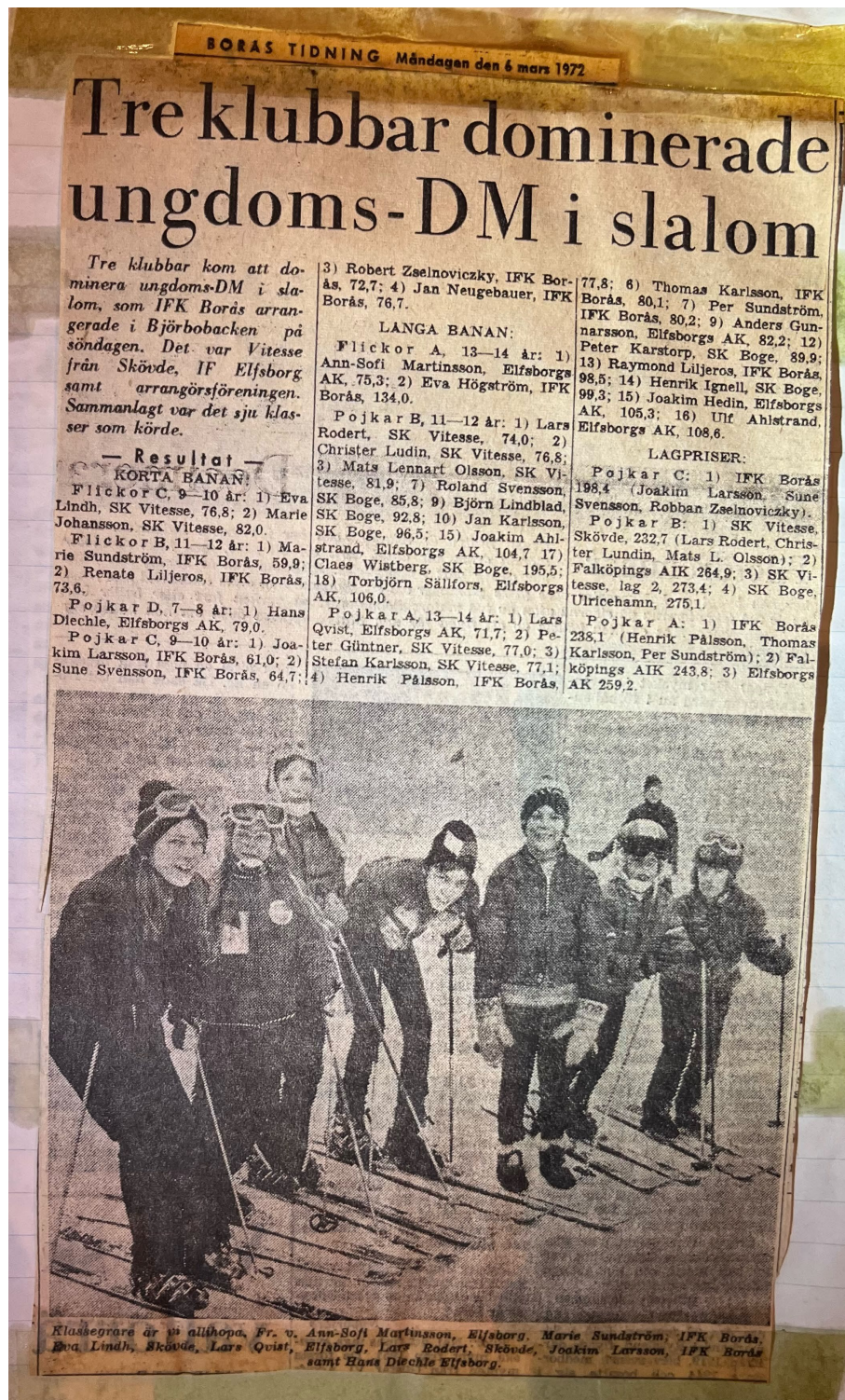
Vitesseframgångar vid Ungdoms-DM i Björbobacken Borås