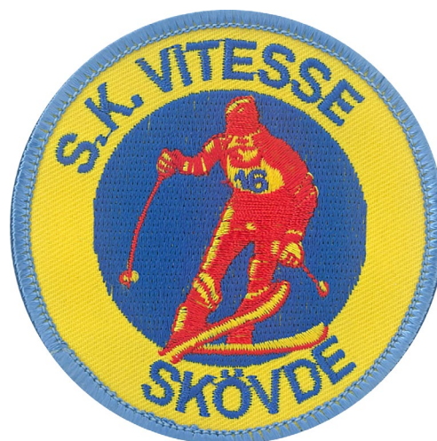
BRODERAT KLUBBMÄRKE 1985-2001